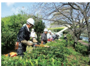
講習(刈込み鋏)の様子

植木手入れ作業は、ご依頼が集中する九月～十二月の期間は特に忙しく、体力を要するお仕事である一方、お客様に喜んでいただけることや、植木班の仲間との協働から、大きなやりがいや味わうことができるお仕事です。